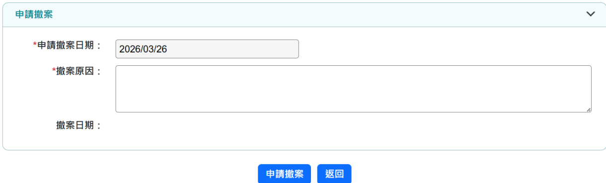
圖 33 申請撤案-填寫原因畫面