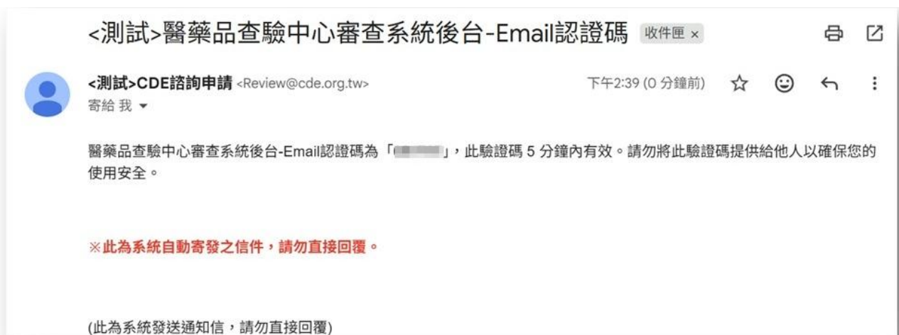
圖 8 忘記密碼-Email 認證碼畫面

(2) 須前往所填寫之電子信箱取得驗證碼，輸入後點選 [送出] 即可完成密碼變更程序。(如圖 8)。