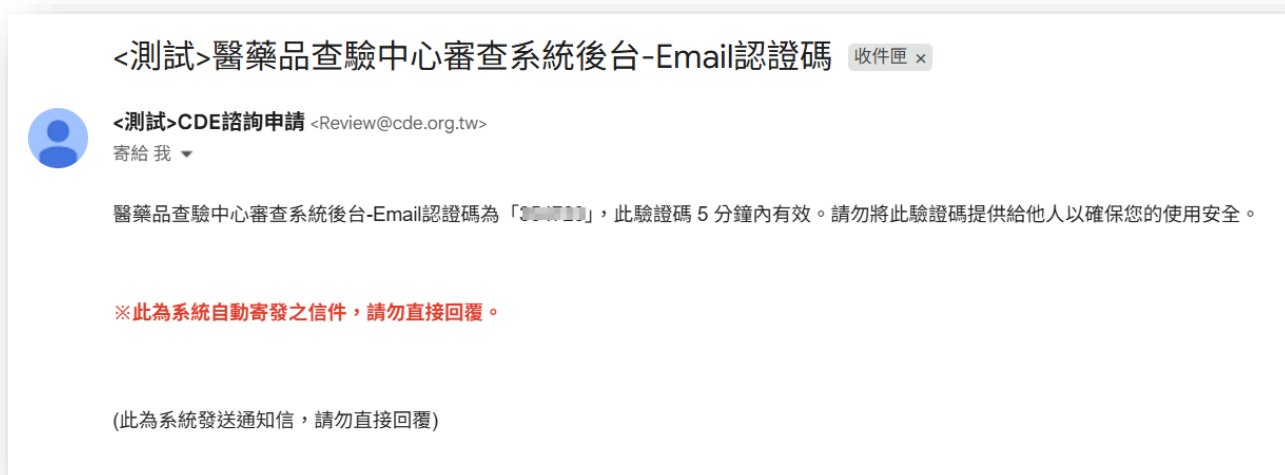
圖 5 至信箱內取得登入認證碼畫面