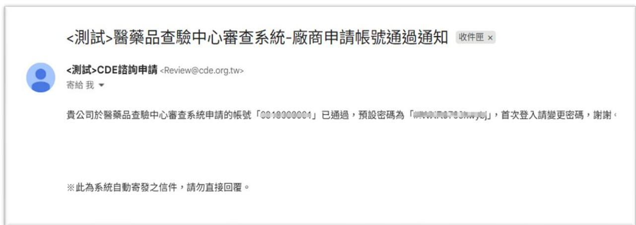
圖 11 申請帳號審核通過信件畫面

https://www.cde.org.tw/cirb/1402/1987/20276/normalPost