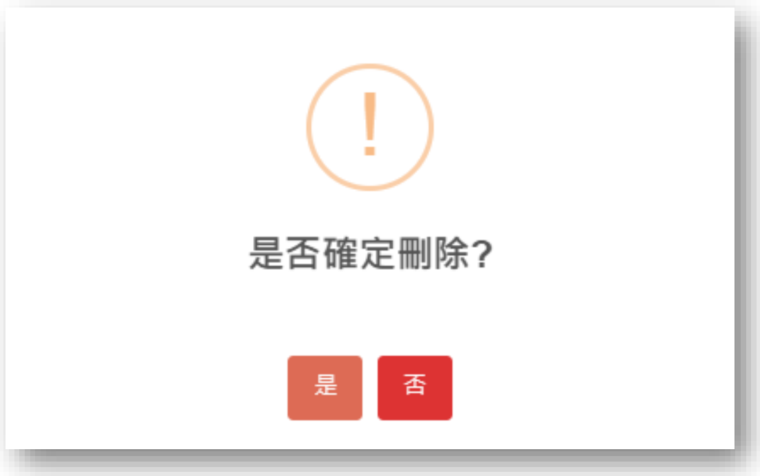
圖 36 刪除案件視窗畫面