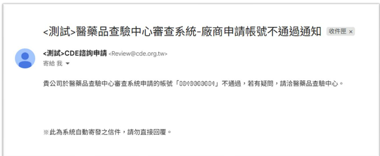
圖 12 申請帳號審核不通過信件畫面