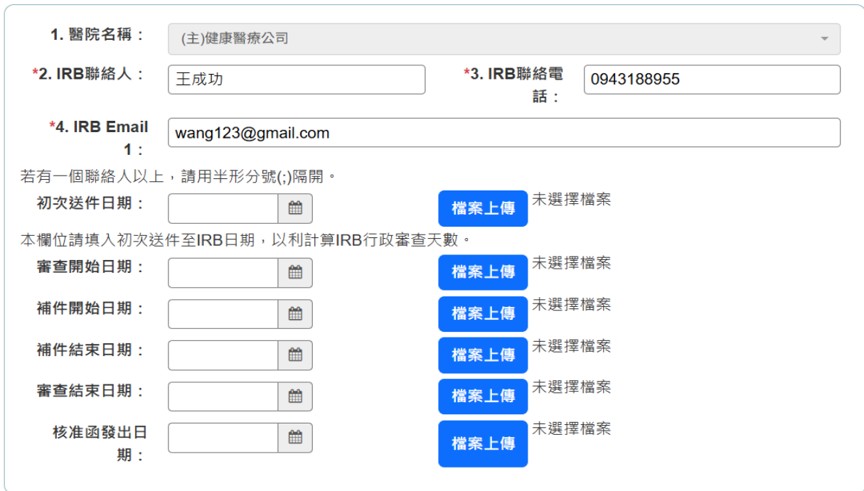
圖 26 編輯主審醫院畫面