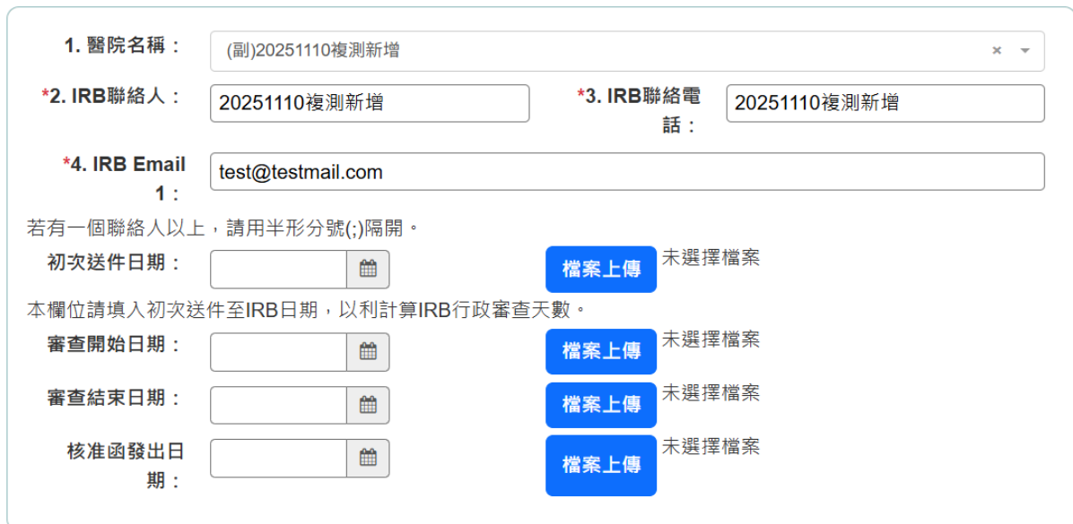
圖 27 新增副審醫院畫面