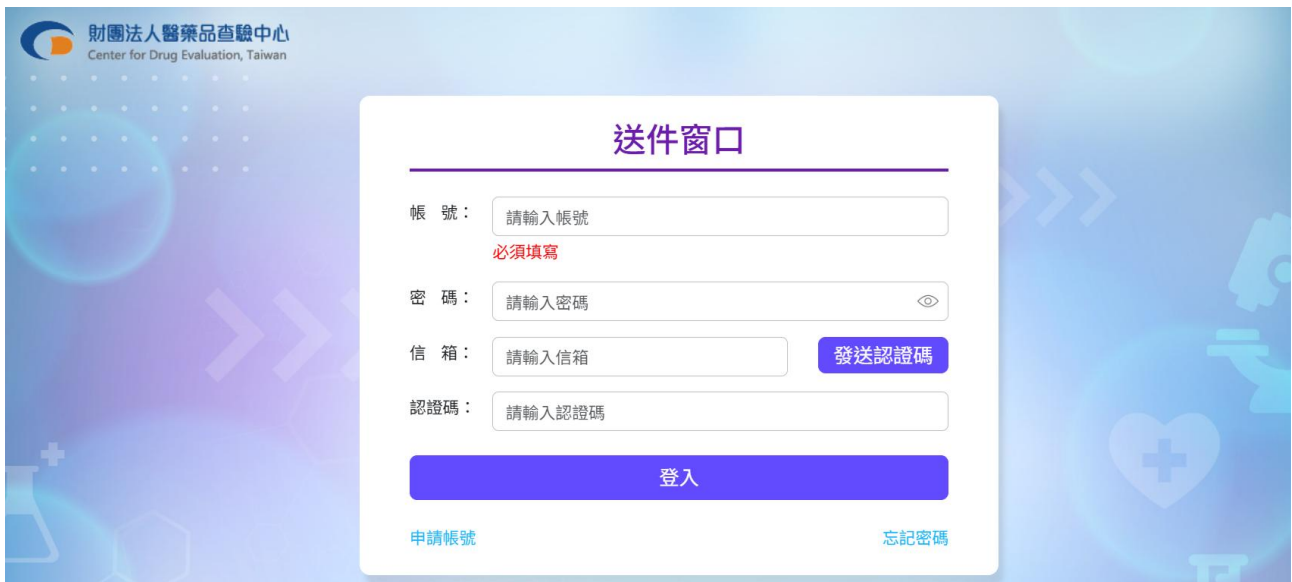
圖 6 登入窗口畫面