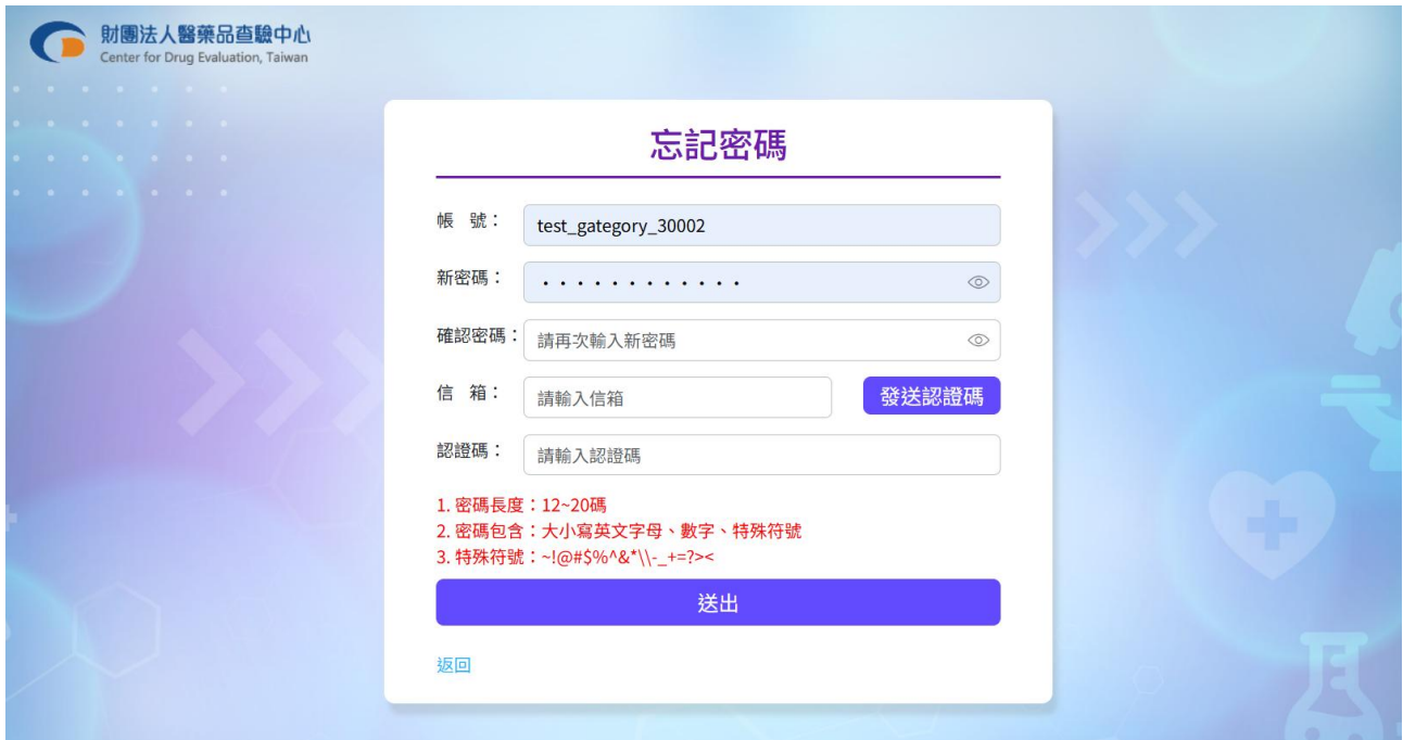
圖 7 忘記密碼或變更密碼設定畫面

(2) 須前往所填寫之電子信箱取得驗證碼，輸入後點選 [送出] 即可完成密碼變更程序。(如圖 8)。